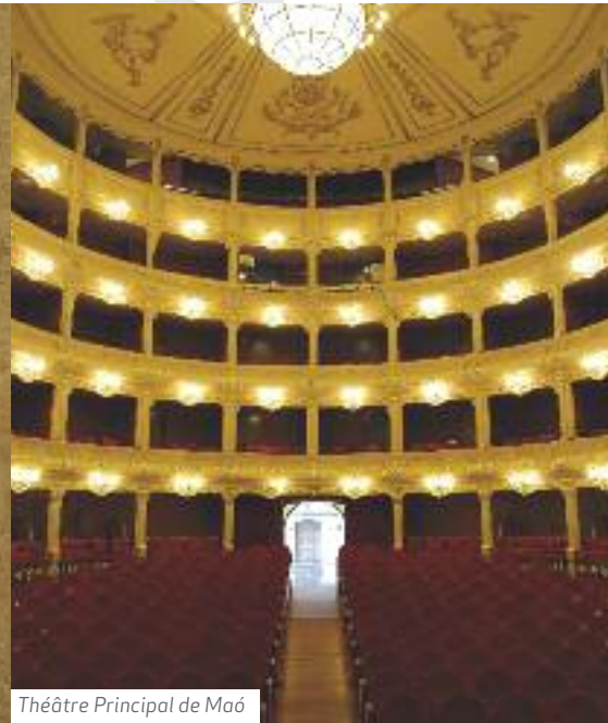
Théâtre Principal de Maó