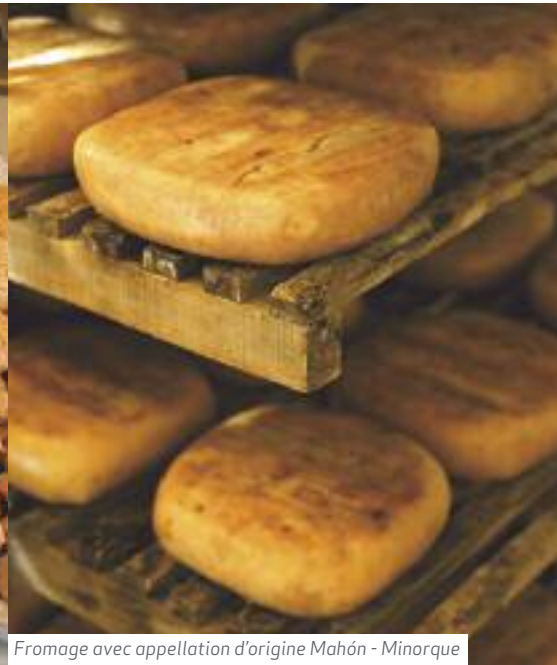
Fromage avec appellation d'origine Mahón - Minorque