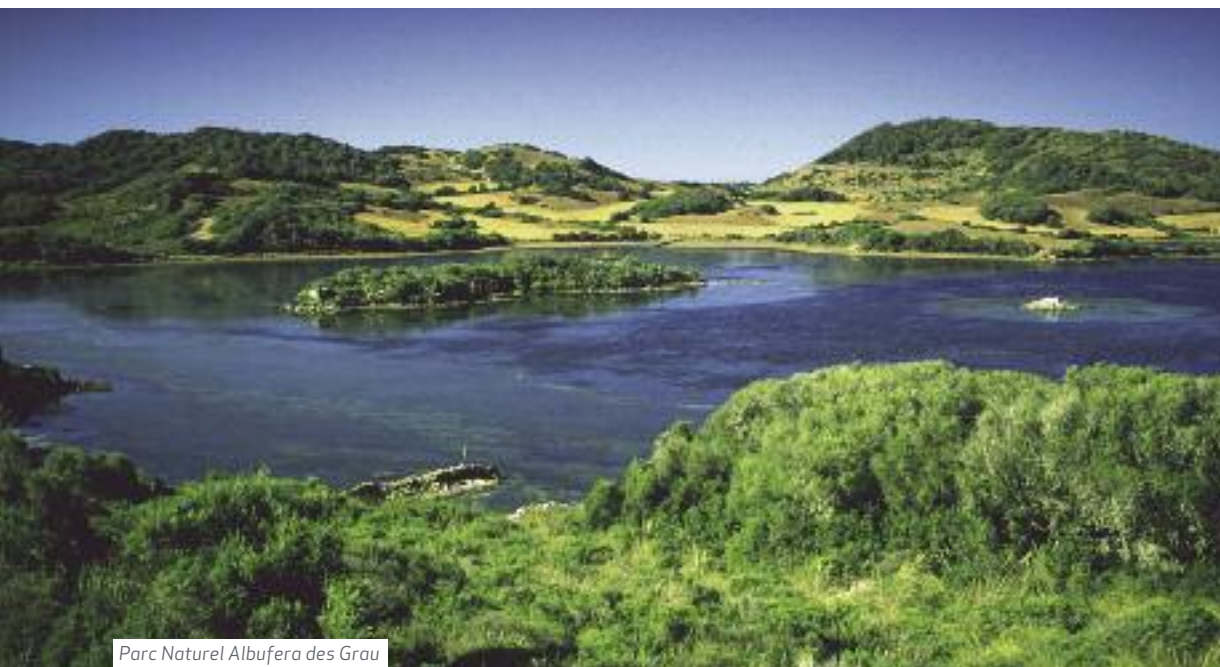
Parc Naturel Albufera des Grau