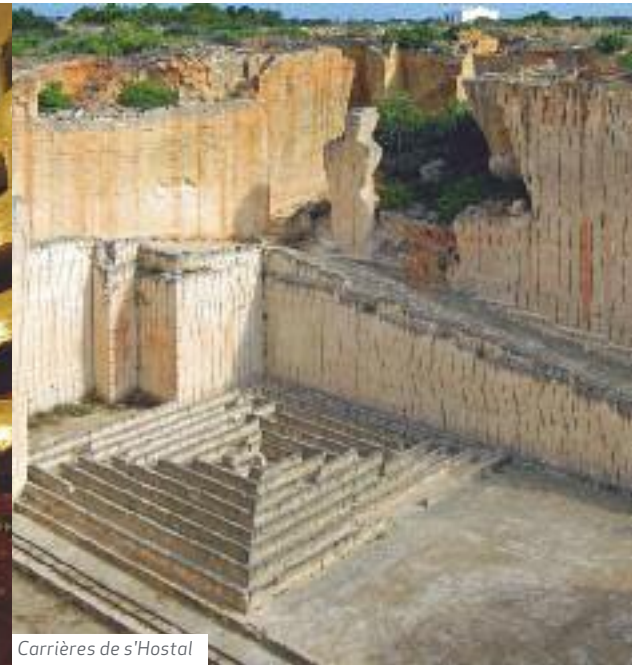
Carrières de s'Hostal

Un cadre exceptionnel pour des réunions et des congrès