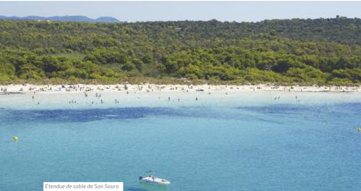
Etendue de sable de Son Saura