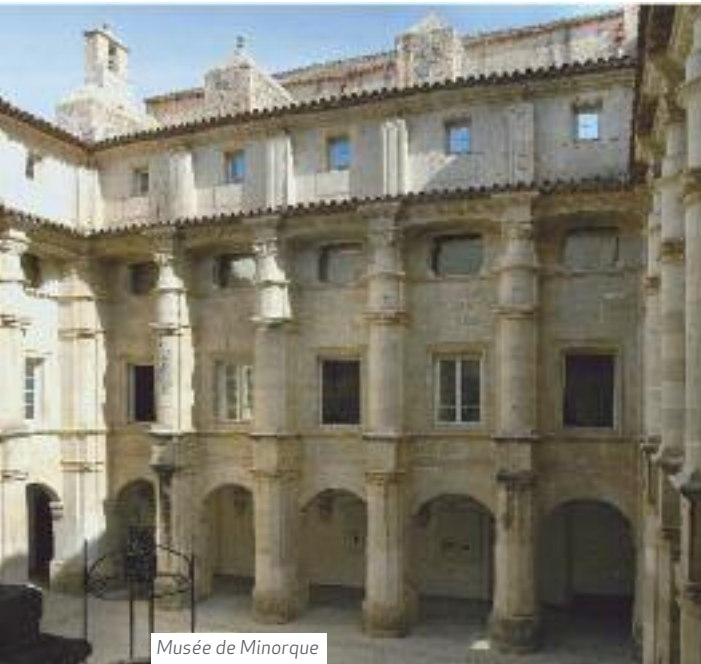
Musée de Minorque