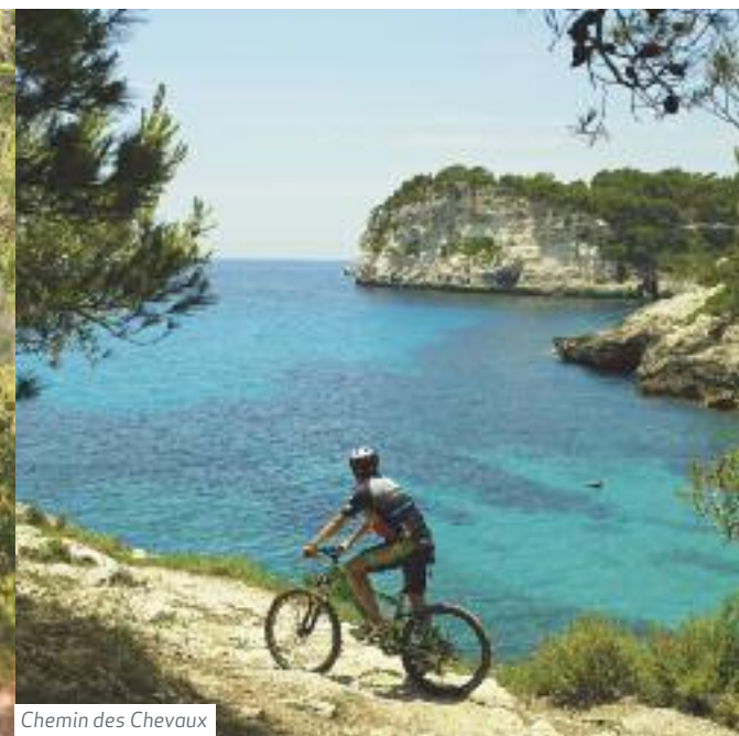
Chemin des Chevaux

A partir de Cala Tirant, les plages sont spectaculaires. Façonnées par les vents de la Tramontane, avec du sable de couleurs différentes et des petites zones humides. De véritables paradis pour la baignade, comme Cala Tirant, Cavalleria, Cala Pregonda et les superbes étendues de sable de Cala Pilar et Algaiarens. Cala Pilar possède un sable avec des touches rougeâtres, presque pourpres.