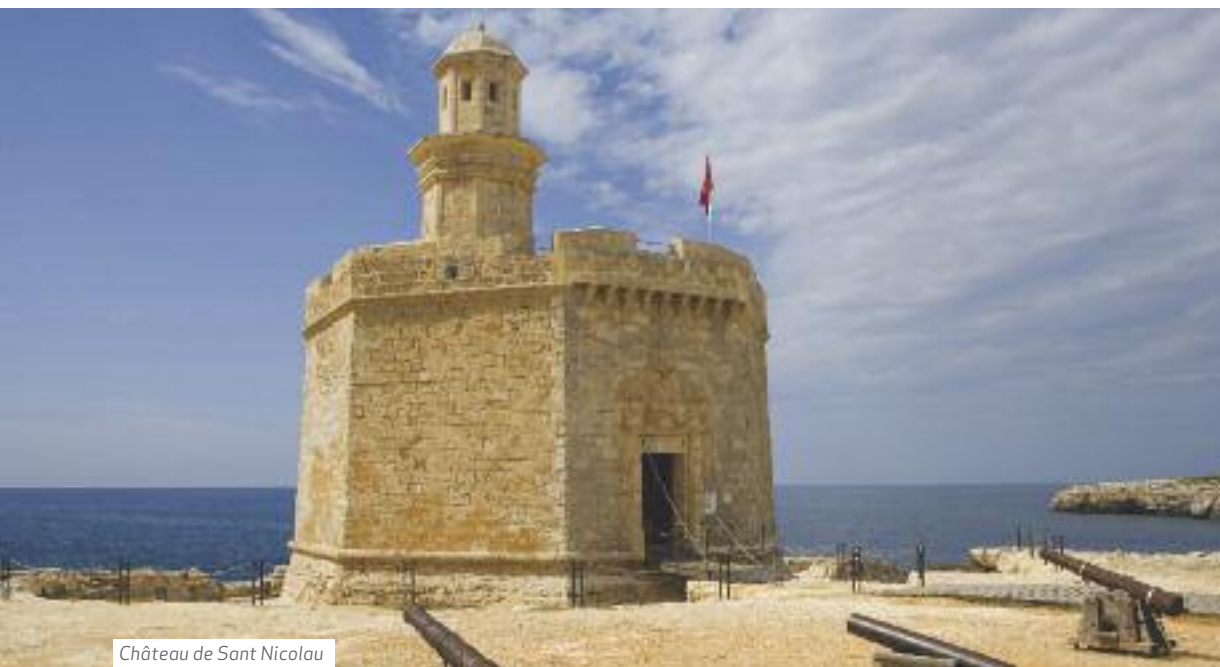
Château de Sant Nicolau