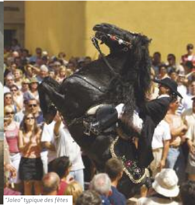
"Jaleo" typique des fêtes

La grandeur des monuments préhistoriques s'avère troublante pour l'homme moderne. Les "taulas", une dalle verticale qui en supporte une autre horizontalement, ont une signification tellement magique qu'elles impressionnent même ceux qui ignorent tout sur l'histoire.