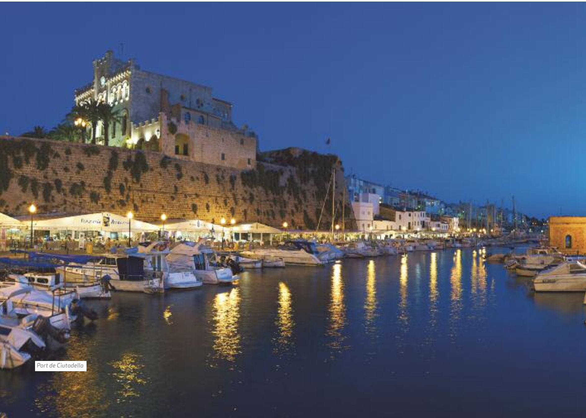
Port de Ciutadella