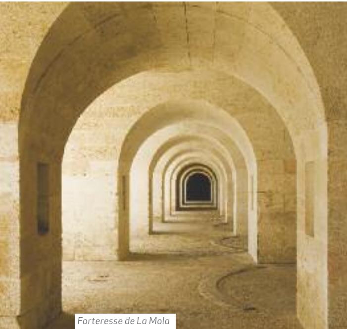
Forteresse de La Mola