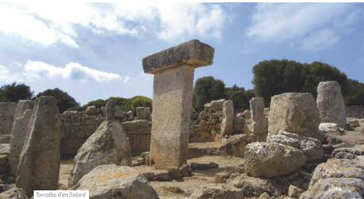
Torralba d'en Salord