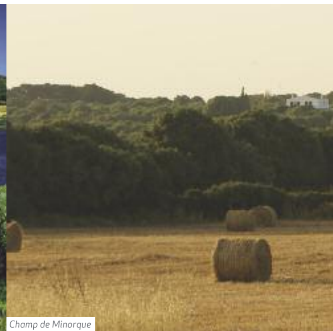
Champ de Minorque