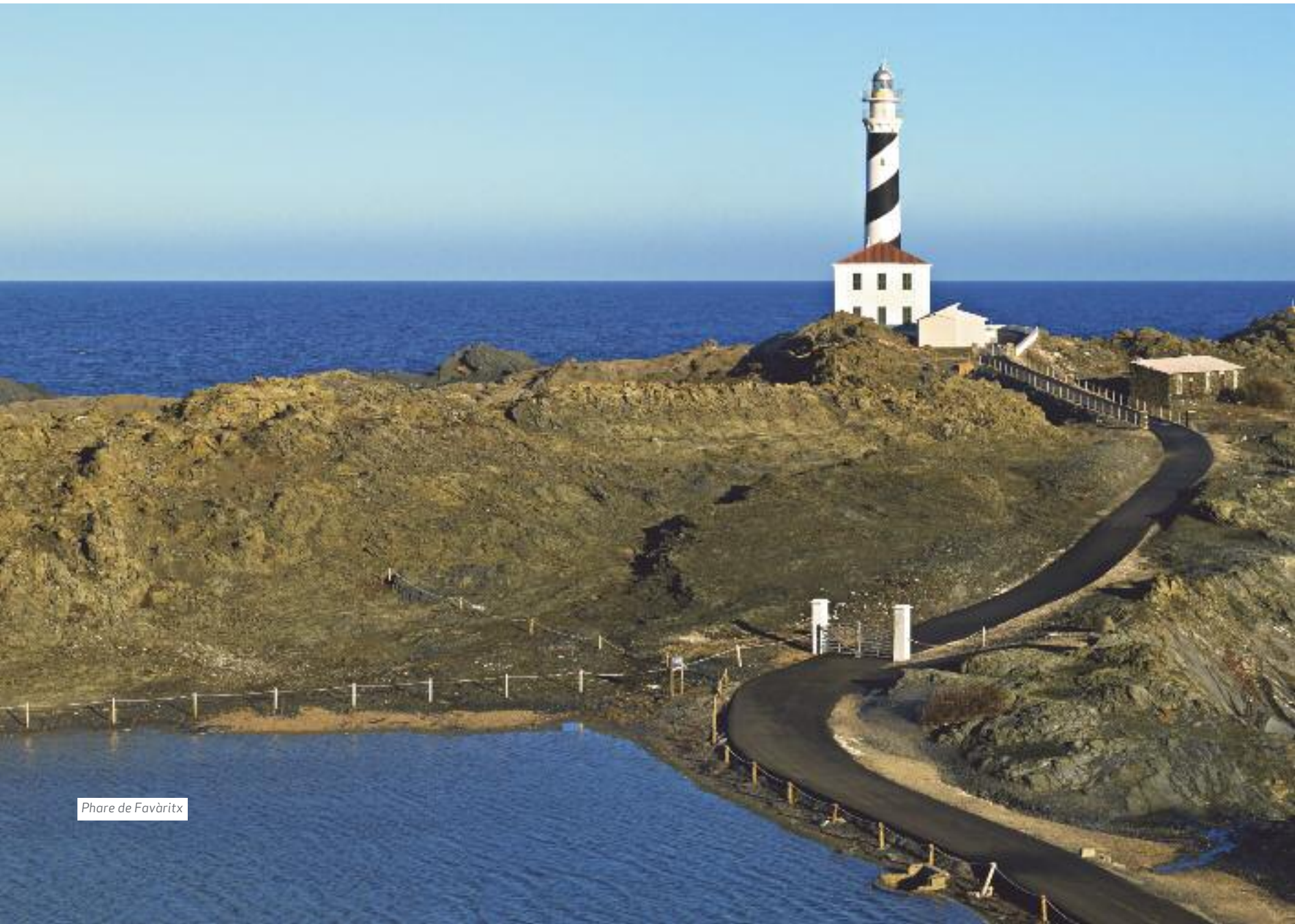
Phare de Favàritx