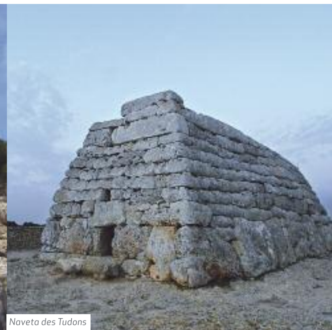
Naveta des Tudons